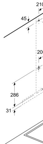
Dimensiuni în mm

În cazul utilizării unui designul aparatului tre